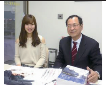
インターンシップ好評

町田市議会 〒194-8520 東京都 町田市森野 2-2-22 ☎042-724-2171 「保守の会」派室 自宅 042-795-7361 FAX 042-795-2726 yoshidaben@gmail.com