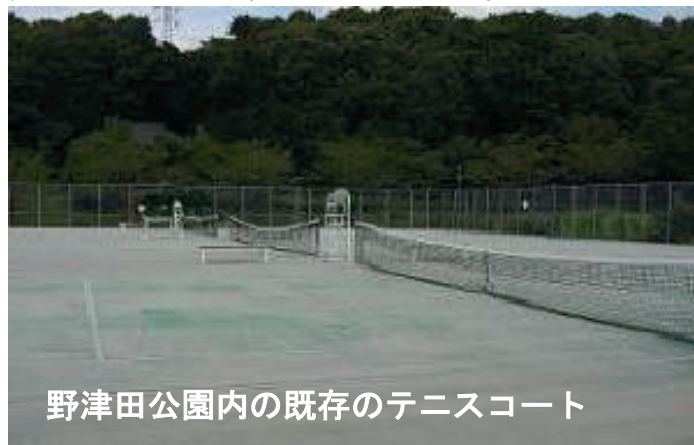
野津田公園内の既存のテニスコート

私は以前からこの用地確保を先行する意義を提案しており、行政の時期の見極めが不足したために、テニスコート12面計画が進まず、意図しない、既存3コートに合わせた、4コートの建設しか出来ない状況に陥っていることが見えてきました。当面の運営を予定するテニスコートが農地（あるいは、養鶏施設）の隣接する場所にでき、果たして、テニス利用者に満足される施設となるか、大きな疑問点が生じてきました。行政はそうした土地配置を十分に認識して、これまでの野津田公園のスポーツ施設整備をすすめたいというスポーツ愛好者があるからと言って、購入時期の判断の引き延ばしをしてきたことが事態の「どんづまり」を招いている可能性を感じました。それが、多岐な事業が盛り込まれた野津田公園整備計画の特徴だと思います。