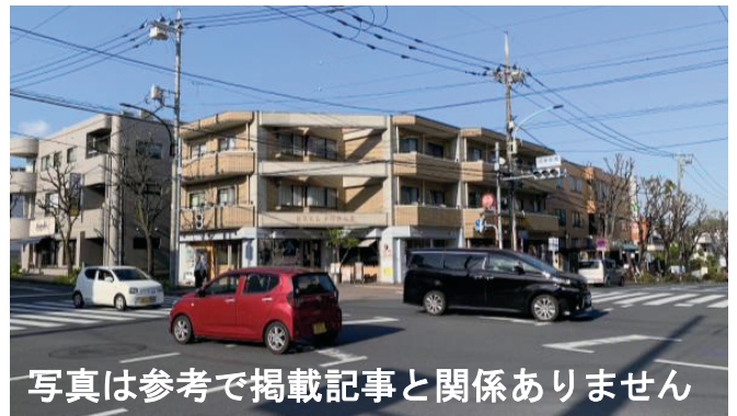
写真は参考で掲載記事と関係ありません

飲食物の配達料(消費者負担分)や配達代行手数料(事業者負担分)を補助する事業費支出であり、補助対象経費の全額が手当されます。その理由は、国が新型コロナ時代を想定した「新しい生活様式」の実践例として「食事のデリバリー・テイクアウト」を促進していることに基づくものです。