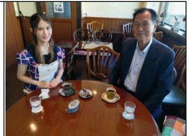
インターン生募集中