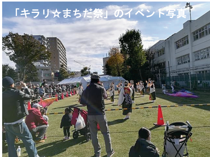
「キラリ☆まちだ祭」のイベント写真

オリンピックの聖火リレーが全国を巡り、7月9日に町田市のシバヒロに到着する予定が組まれています。果たして、その時期にコロナワクチンの市民接種がどこまで進んでいるか疑問です。オリンピック関連行事の開催を再検討するべきであると主張します。